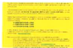
AVIS ENQUÊTE PUBLIQUE - PROJET DE DÉCLASSEMENT D'UNE EMPRISE DU PARKING FOCH