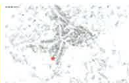
ENQUÊTE PUBLIQUE PRÉALABLE AU DÉCLASSEMENT D'UNE PARTIE DU PARKING FOCH