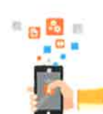
DOSSIER D'INFORMATION : Modification d'une antenne au PLAN DE LA TOUR