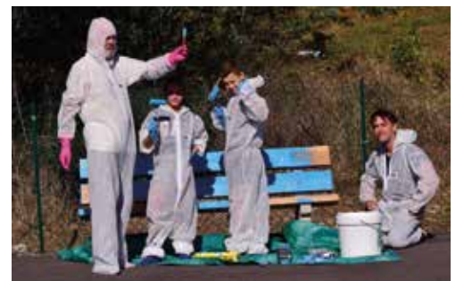
Peinture des bancs du Skate Park