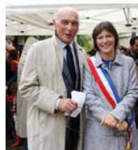
Madame le Maire et Monsieur James Faulkner, comédien britannique, lecteur de texte ce 11 novembre 2018

Vous pouvez découvrir ses plaques en commençant par La Place de la Victoire autrefois place des Mûriers un QR Code explicatif vous donnera toutes les informations.